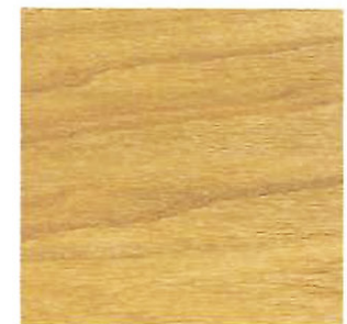
Gloss Sheen Acabado brillante

Sheen representation may differ slightly from actual coating.